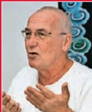
Master Han Shan